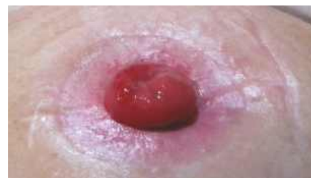
vyhojené okolie stómie