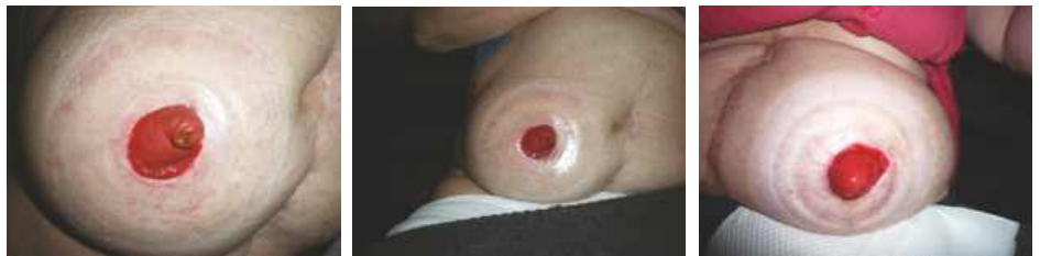
Hernia – ilustračná foto

Parastomálna hernia sa vyskytuje u pacientov po vyvedení stómie ako jedna z možných pooperačných komplikácií. Je to najčastejšia komplikácia stómie, vyskytuje sa až u polovice pacientov. Určitý stupeň herniácie okolo stómie je taký bežný, že táto komplikácia sa môže posudzovať ako nevyhnutná.