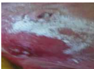
po 5 dňoch

Na ilustráciu uvádzam prípad 2 mesačného dieťaťa