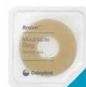
Tvarovateľný krúžok Brava