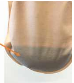
Vrecko s netkanou textíliou telovej farby

Vrecko SenSura® Mio odpuďuje vodu, látka je stála, aj po sprchovaní alebo kúpaní. Vrecko je príjemné na dotyk.