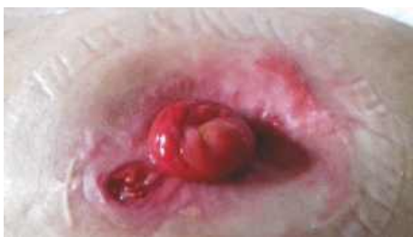
podráždená pokožka v okolí