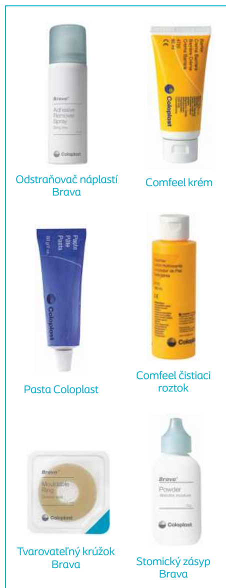
Odstraňovač náplastí Brava