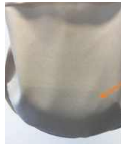
SenSura® Mio s tkanou textíliou šedej farby

Obsah vrecka SenSura® Mio nie je vidieť cez textíliu a nepúta pozornosť. Naproti tomu, obsah vreciek telovej farby je viditeľný a robí vrecko nápadným.