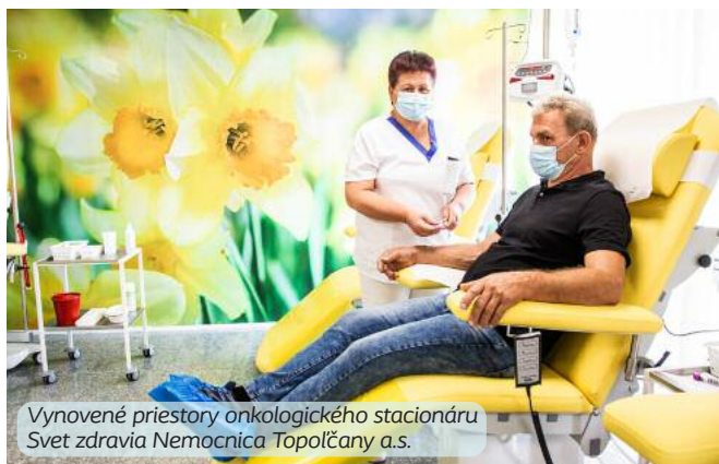
Vynovené priestory onkologického stacionáru Svet zdravia Nemocnica Topolčany a.s.