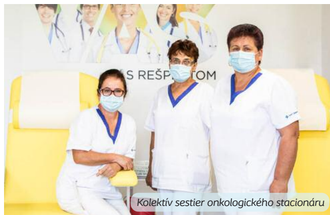
Kolektív sestier onkologického stacionáru