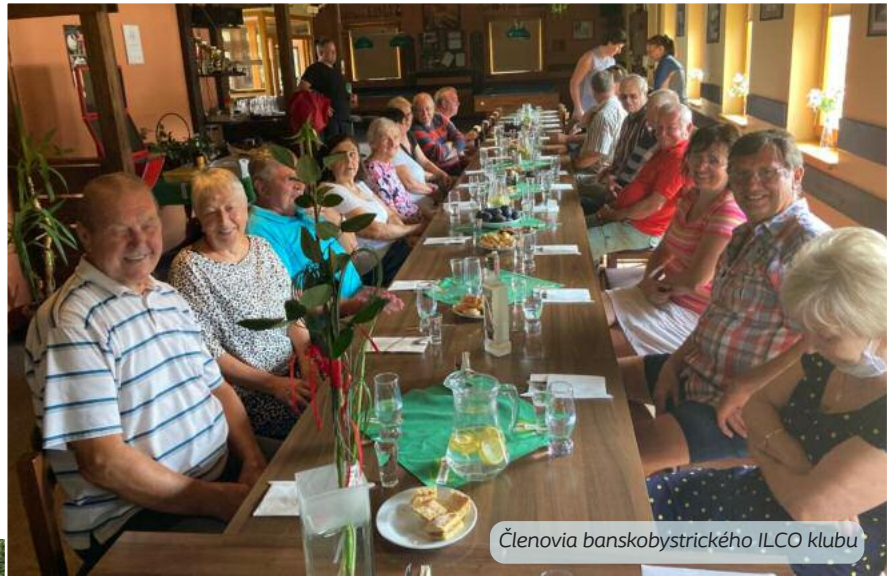
Členovia banskobystričského ILCO klubu