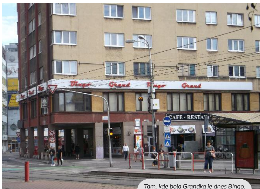
Tam, kde bola Grandka je dnes Bingo.