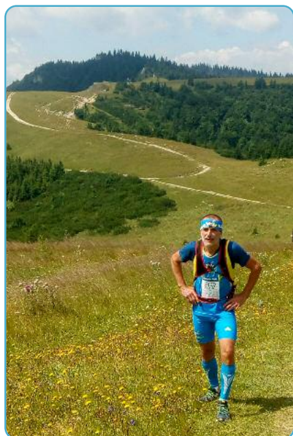
Helios / Jeseň 2020

V „Maratón klube Rajec“, ktorého som predsedom, organizujeme preteky - Rajecký Borošovec - 14 km beh v teréne, duatlon, triatlon, behy pre deti a Rajecký maratón, ktorého súčasťou je aj polmaratón, štafetový polmaratón (4 x 5 km), preteky na kolieskových korčuľiach a súťaže detí. V minulom roku sa postavilo na štart vo všetkých disciplínach v rámci Rajeckého maratónu 1 400 pretekárov z 11 štátov. Máme najkrajšiu a zároveň najťažšiu maratónsku trať na Slovensku a cesta z Rajca do Čičmian je počas pretekov na 5 hodín uzatvorená pre motorové vozidlá.