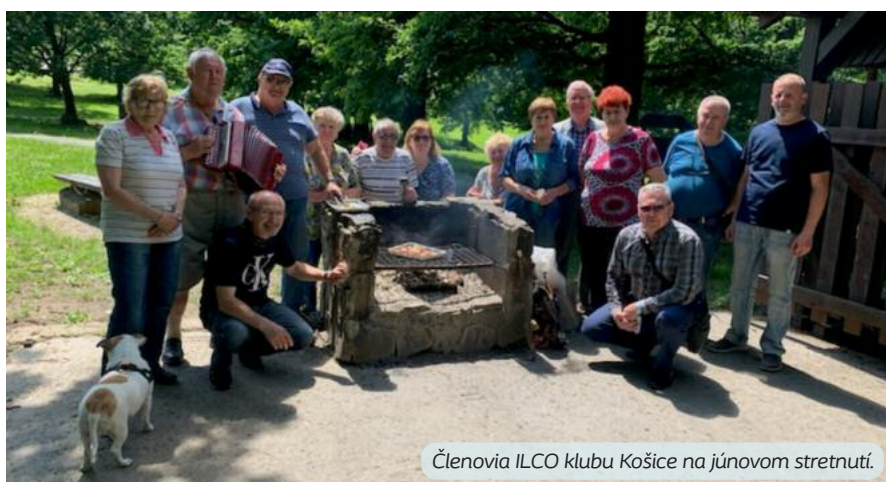
Členovia ILCO klubu Košice na júnovom stretnutí.

Spracovala MÁRIA MICHNOVÁ , Svet zdravia, Nemocnica Topolčany, a. s., a ADRIANA ŠATKOVÁ , Coloplast