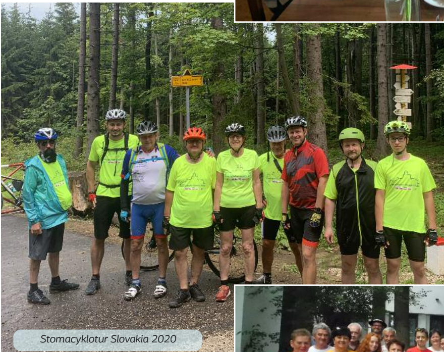
Stomacyklotur Slovakia 2020