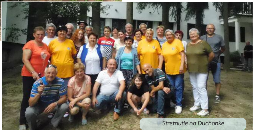
Stretnutie na Duchonke